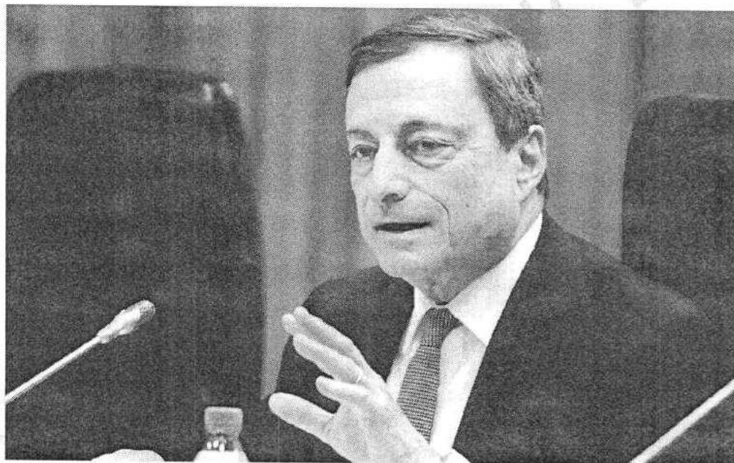
Il presidente della Banca Centrale Europea Mario Draghi

I mercati prendono nota, con la borsa di Milano che recupera il terreno perso negli ultimi mesi rispetto ai listini europei chiudendo ai massimi di quattro anni (+0,57%). L'Europa, invece, prende il respiro con Parigi in rosso (-0,55%) e Francoforte positiva (+0,27%). Lo spread è in lieve rialzo ma sempre sotto 100 (a 96), con il tasso dei Btp che tuttavia continua a scivolare assestandosi a 1,27%, mentre l'euro non arresta la sua caduta portandosi ancora un po' più vicino alla parità sul dollaro, a 1,0823 ai minimi dal settembre 2003.