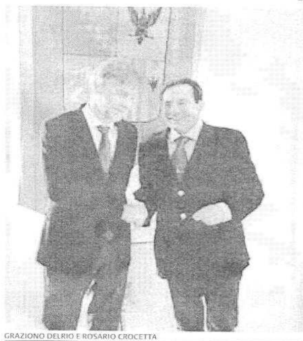
GRAZIANO DELRIO E ROSARIO CROCETTA

Però, i tecnici regionali e ministeriali sono ancora in una fase interlocutoria. Non c'è ancora nulla di concreto. Solo ipotesi che bisogna fare maturare nel più breve tempo possibile. Dei quattro mesi di esercizio provvisorio, sono trascorsi oltre due mesi: 69 giorni sui 120 complessivi, a decorrere dall'1 gennaio 2015.